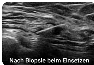
Nach Biopsie beim Einsetzen

Indiziert für Weichgewebe, einschließlich Brustgewebe und axilläre Lymphknoten.