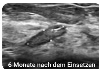
6 Monate nach dem Einsetzen

Bietet verbesserte Langzeitsichtbarkeit unter Ultraschall und dadurch eine einfachere präoperative Lokalisation. 1