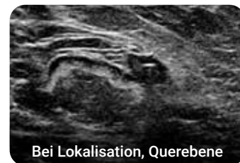
Bei Lokalisation, Querebene